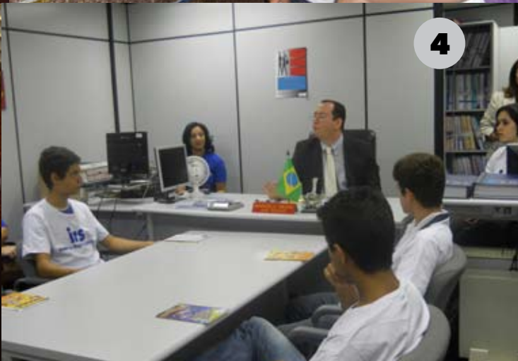
(1) Semana Pedagógica / (2) Expo Humanidade / (3) Congresso Iberoamericano / (4) Visita ao Tribunal Regional do Trabalho

fidelizadas, entre elas a renovação, por mais dois anos, do Termo de Cooperação com a Secretaria Municipal de Educação do Rio de Janeiro. Através de outras parcerias, doações foram recebidas proporcionando ao IRS