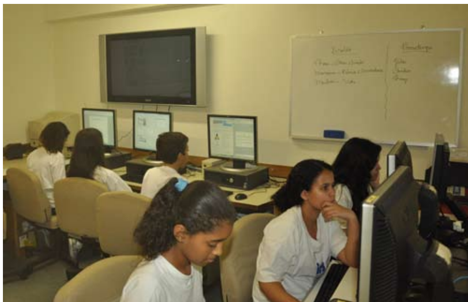
Espaço de Informática, um dos mais contemplados com as doações